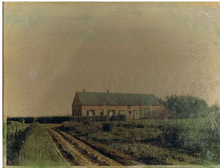
Boerderij Losbaan, 1950

Mijn vader had een boerderij gebouwd. De bouw was begin 1929 klaar gekomen, met ook een paar kippenhokken. Dit alles betaalde hij contant uit eigen zak. Hij had hiervoor gespaard en hard gewerkt, en ook geprofiteerd van de gouden jaren twintig. Er werd destijds eerst gespaard en dan pas geïnvesteerd. Dit was ook de leerschool van de jaren twintig. De bouwgrond van mijn vader lag op de grens van de gemeenten Grubbenvorst en Horst. De grond aan de Horster kant van de grens was niet te koop. Daarop besloot mijn vader dan maar vijf meter over de grens te bouwen.