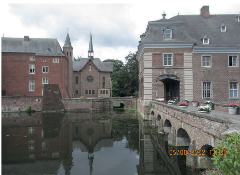
Hoofdingang Schloss Wissen met kapel